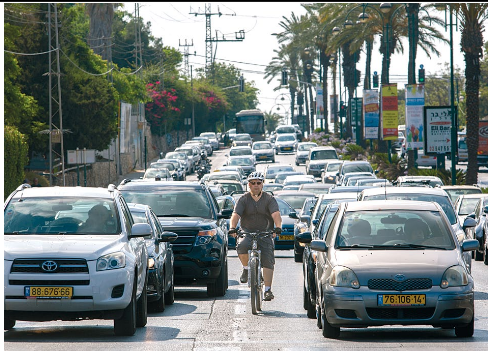
הדרך לעבודה. "אם 10% מתושבי רמת השרון יעברו לאופניים, ייחסך לכולם זמן בכביש"